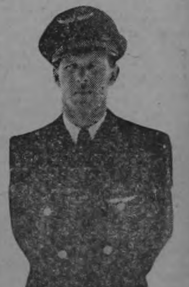
TNTE. CORONEL NUÑEZ ...espera el pueblo