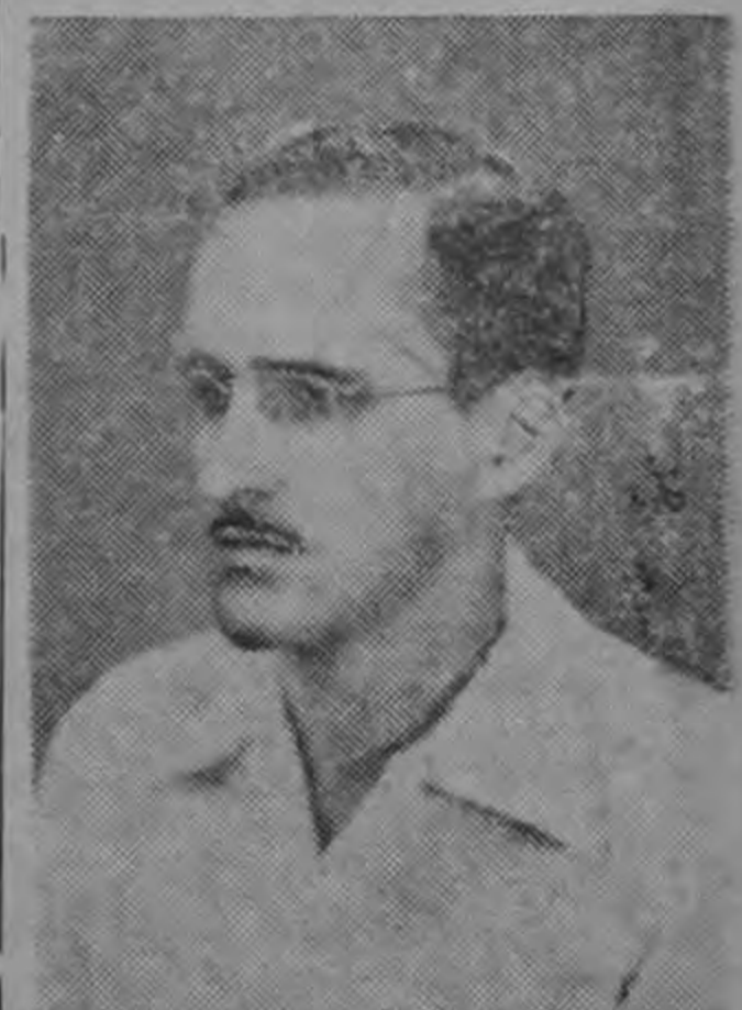
DIPUTADO VICENTE ...beneficio a la industria nacional...