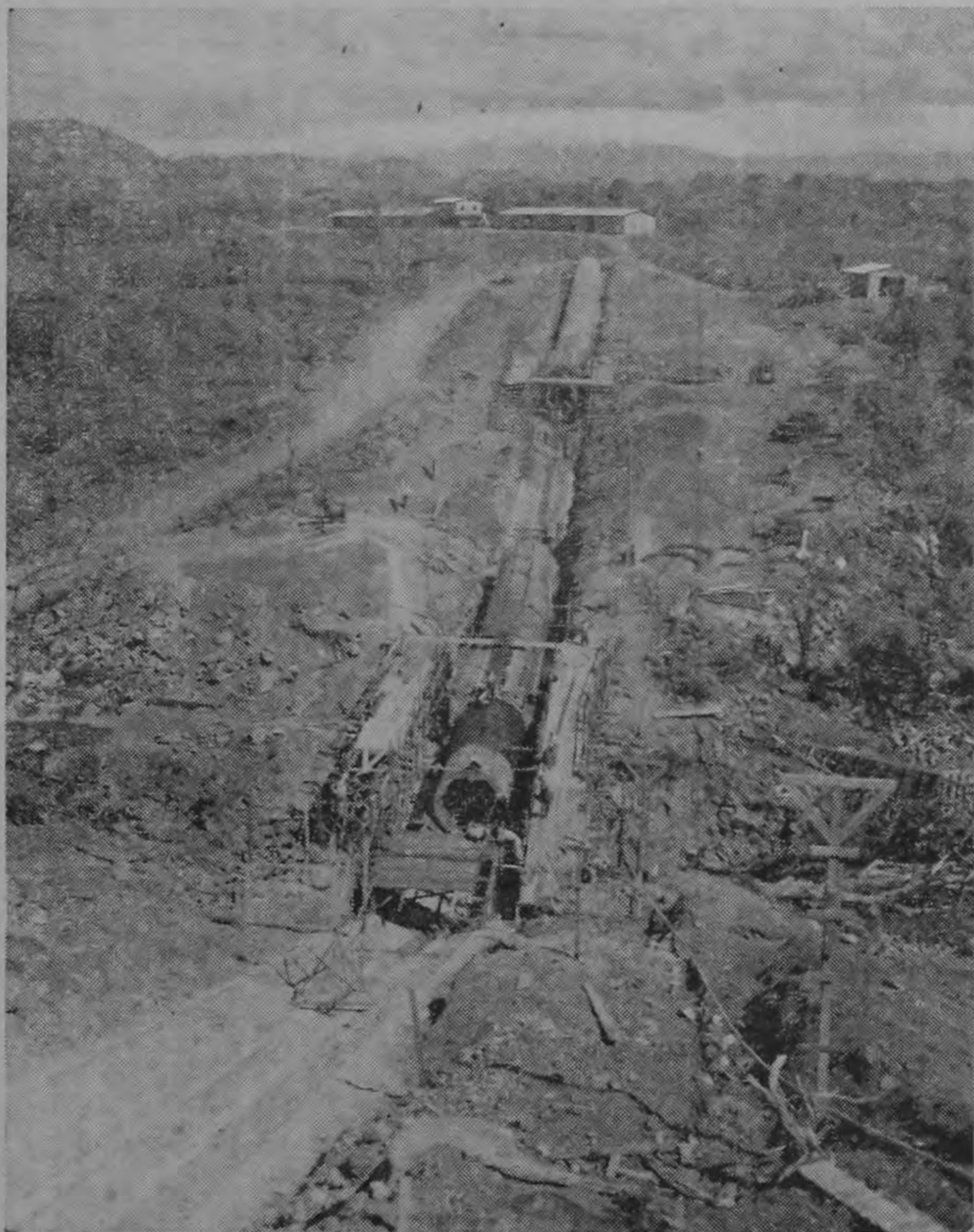
Vista panorámica del sifón en el paso del río Tizate.— Una de las grandes obras del PROYECTO HIDROELECTRICO DE LA GARITA.— Su largo es de 264 metros con un diámetro de 3.24 metros.

se están llevando a cabo los planes de electrificación nacional.